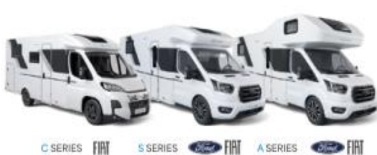
C SERIES FIAT