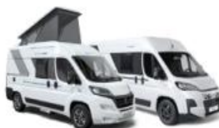
V SERIES FIAT